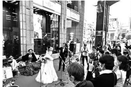
神戸元町ミュージックウィーク2022 ストリート風景

通りを歩いていると、辻々で見える六甲山、感じられる海の気配。時に山風、時に海風の湿り気と匂いは場所性を感じさせてくれる。それぞれの場所では、場の特徴を生かした魅力を発信する取り組みも行われている。私が拠点の一つを置く六甲山では、六甲山の自然を楽しみながら、各施設を舞台に展示される現代アートをめぐる「六甲ミーツ・アート芸術散歩」が2010年から毎年開催、13回目を迎え六甲山の特徴あるアートイベントに成長してきている。2017年からは時期を重ねて「六甲山名建築探訪ツアー」も開催され、自然とともにアートや建築に親しむものとなっている。ただ、六甲山に住む人口は少