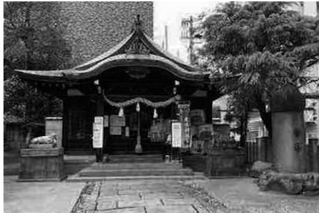
走水神社(1958再建)脇には存在感のある筆塚

程近く、元町商店街から一本南に下ると、しっとりとした佇む走水神社がある。街中にあるこの神社は天照大神・応神天皇・菅原道真を主祭神とし、1100年以上の歴史があるという。天神様、学問の神として崇められる菅原