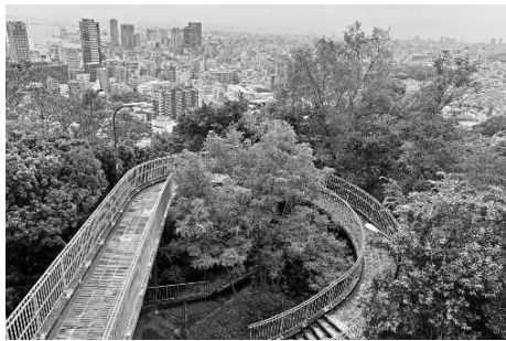
ビーナスブリッジ

みなと元町近辺から坂道を上り、1キロほど先の「諏訪山公園」へ向かいました。個性的な飲食店が並ぶ繁華街から生田新道を越えると、落ち着いた街並みに変わります。この辺りは行政の中核施設が集まる、いわゆるシビックゾーンです。さらに坂道を進むと住宅が増え、点在する学校や教会が見えてきます。立派な日本庭園をもつ相楽園があり緑豊かなエリアです。その先のバス道、山麓線までは、みなと元町から歩いて15分ほどです。名前の通り山の麓の曲がりくねった道です。山麓線から「諏訪山公園」へは登山道を上れば到着です。ここまで神戸港から2キロ足らず。海から山までの間に産業、文化、暮らしの都市機能が積層になって存在しています。横に長い神戸の市街地は縦断すると変化に富んだグラデーションがおもしろい。改めて繁華街から山の中まで、わずかな距離だと分かりましたが坂道がきついので縦断するのは結構大変です。